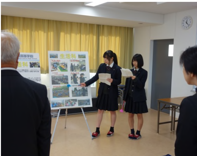
【校舎見学会の様子】