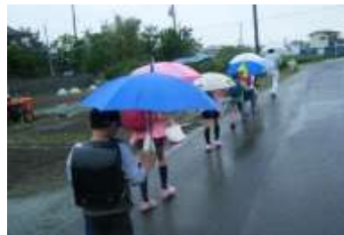
● 避難所へ避難(荒浜小)