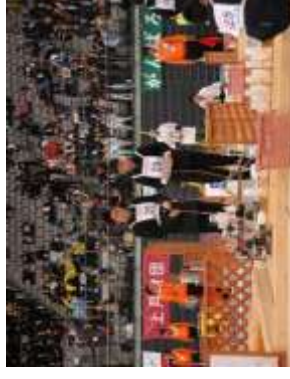
ロボット競技大会