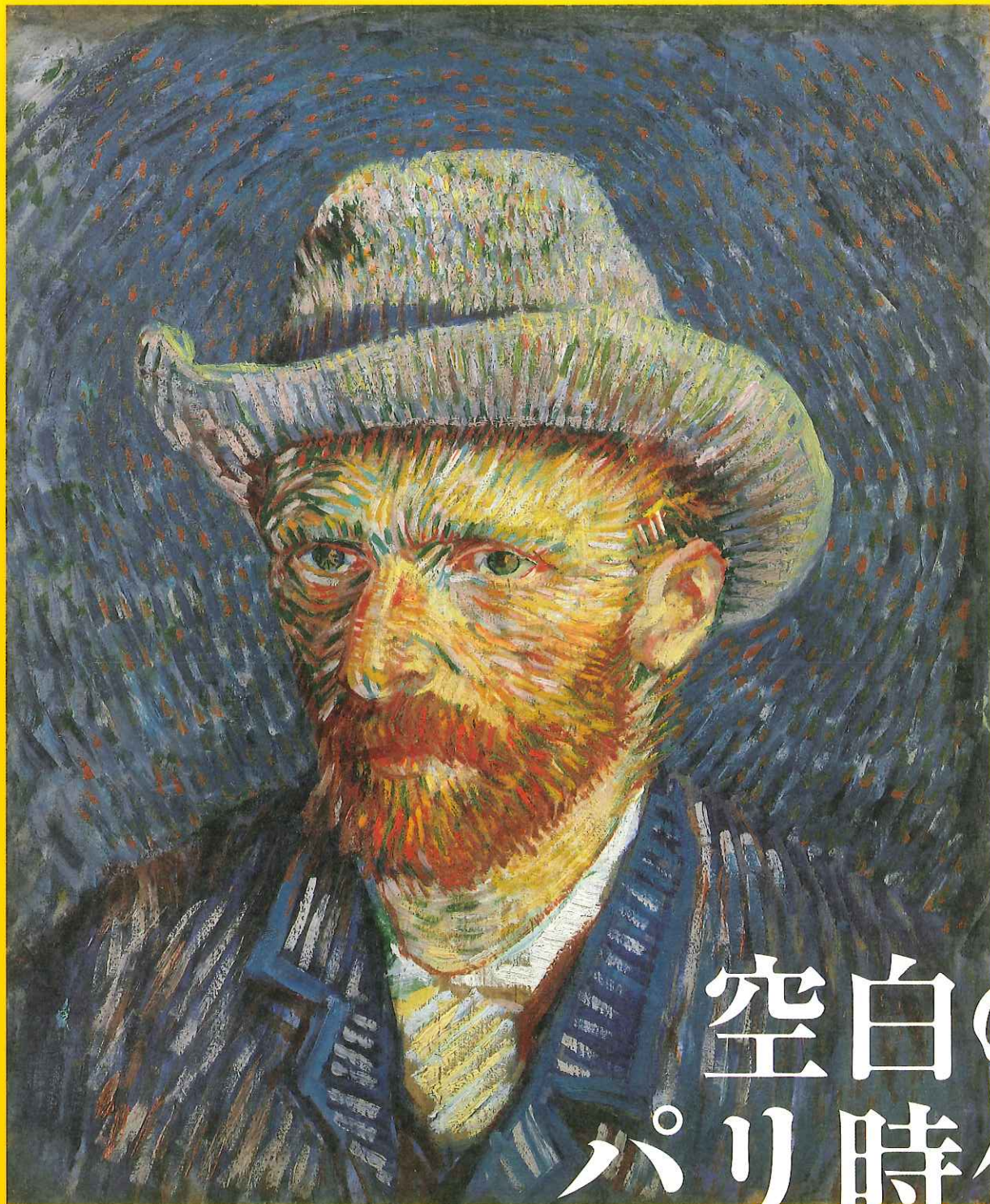
《グレーのフェルト帽の自画像》 Vincent van Gogh (1853 - 1890) Self portrait with grey felt hat, 1887 Paris oil on cotton, 44.5 x 37.2 cm Van Gogh Museum, Amsterdam (Vincent van Gogh Foundation)