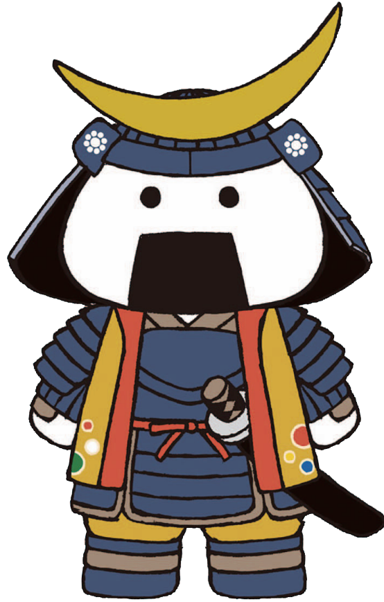
仙台・宮城観光 PR キャラクター 「むすび丸」