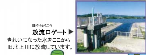
●放流ロケット きれいになった水をここから旧北上川に放流しています。