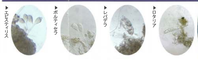
▶ エムステリス ▶ ポルテイヤ ▶ レバクラ ▶ ロタリア