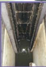
▲スクリーン 浄化センターに流れついた下水は、最初にこの柵を通ります。大きなゴミはここでとりのぞきます。

①沈砂池ポンプ棟 下水中のゴミや土砂を取り除いて、ポンプで最初沈殿池におくります。