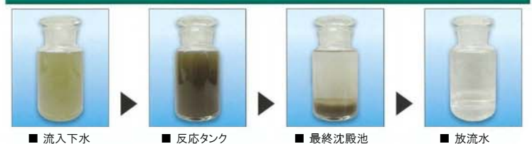
■ 流入下水 ■ 反応タンク ■ 最終沈殿池 ■ 放流水