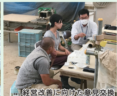
経営改善に向けた意見交換