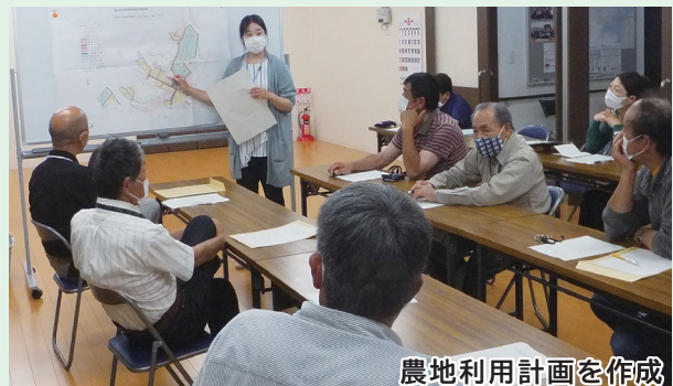
農地利用計画を作成