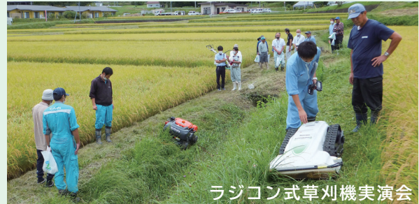
ラジコン式草刈機実演会

中山間地の草刈作業は、長大で傾斜がきつい法面が多く、省力化技術について集落の総会や打合せ時に情報提供しました。その中で、ラジコン草刈機等について関心が高かったため、実演会を9月14日に開催しました。実演会では、各メーカーより草刈機2台・ドローン1台の実演がされ、省力化技術への理解が深まりました。