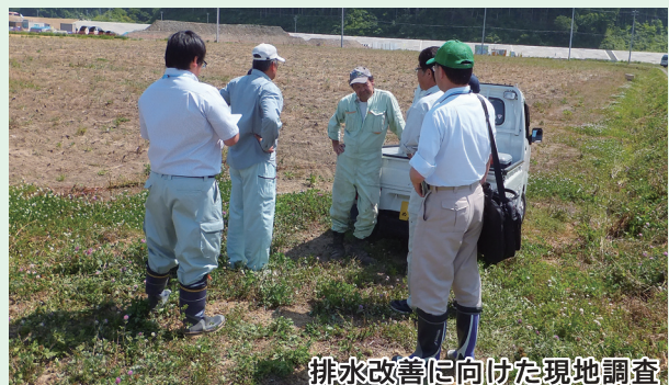
排水改善に向けた現地調査

町やJA等関係機関と連携し、組合への農地集積と効率的利用のための検討会を行いました。露地畑の農地集積率は令和2年度で8割を超え、農地集積が進みました。