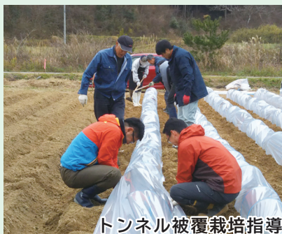
トンネル被覆栽培指導

規模拡大に伴う経営課題の整理・改善に向けて意見交換を実施し、60か所以上に分散したほ場の管理や作業の効率化に向け機械導入等の検討を行いました。対象法人ではほ場管理システムや収穫機械が導入されるなど、計画的・効率的作業に向けた取組が実践されるようになりました。