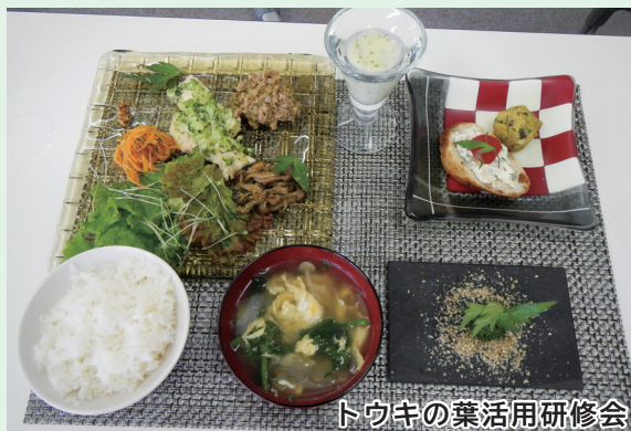
トウキの葉活用研修会