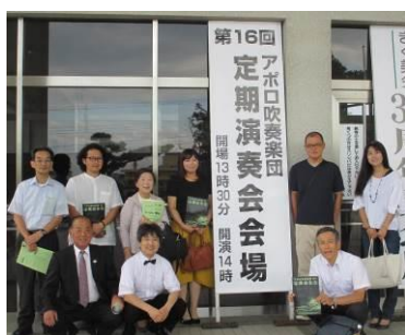
(見学会に参加した協議会会員)

「アポロ吹奏楽団」は、平成8年1月に地域の情報タウン誌「ジョイくりはら」での呼びかけにより集まったメンバーで結成された団体です。多くの方々に音楽を楽しんでもらうことを目的に活動を続けています。