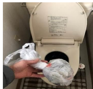
④用を足したら、縛って大袋に入れる