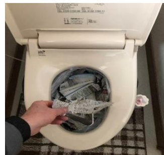
③短冊状に切った尿取りパッドや古新聞など入れる