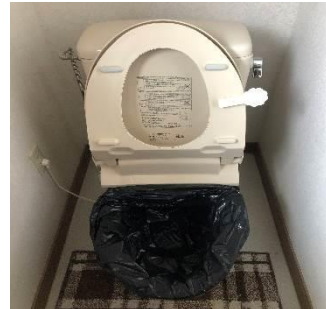
①便座を上げ、ゴミ袋をかぶせ、下げる