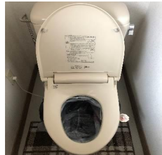
②小ビニール袋かレジ袋を広げ、中に入れる