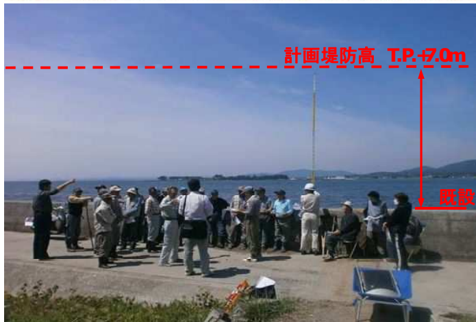
現地での計画堤防高の提示