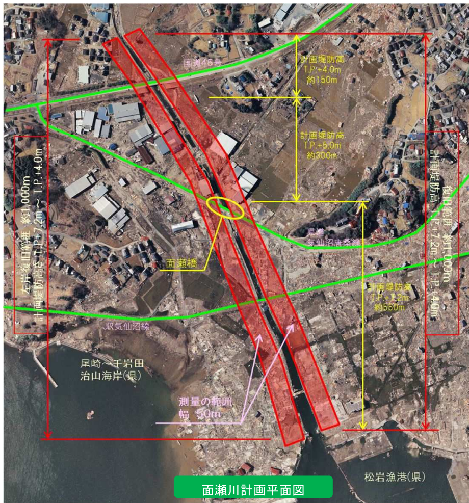
面瀬川計画平面図