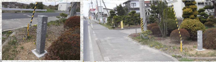
石碑6 気仙沼唐桑線 気仙沼市松崎浦田地先