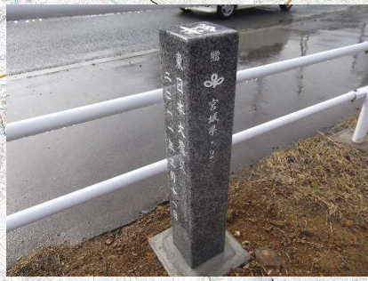
石碑2 気仙沼唐桑線 気仙沼市赤岩館下地先