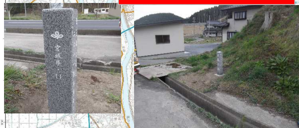
石碑11 国道398号 南三陸町志津川字小森地先