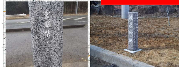
石碑1 国道346号 気仙沼市本吉町猪の鼻地先