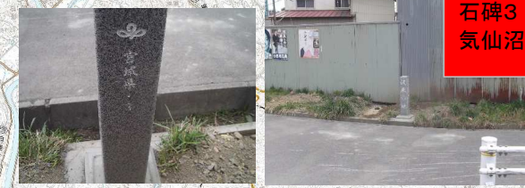
石碑3 本吉室根線 気仙沼市本吉町津谷新明戸地先