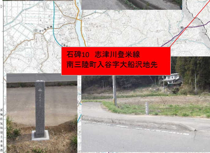
石碑10 志津川登米線 南三陸町入谷字大船沢地先