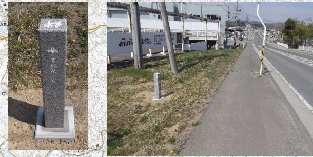
石碑8 気仙沼唐桑線 気仙沼市松崎馬場地先