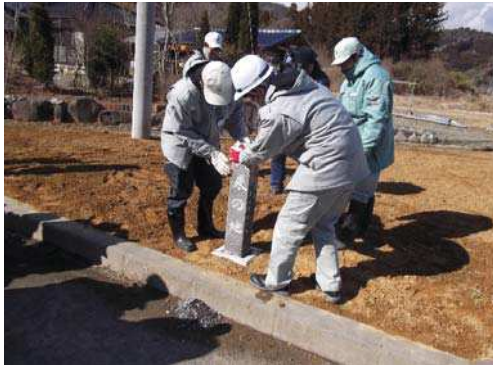
(国)346号での作業状況