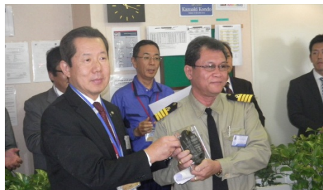
【石巻港整備・利用促進期成同盟会よりキャプテンに楯を贈呈】