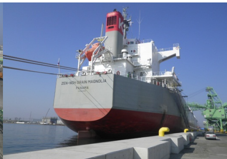
【日和埠頭7号岸壁係留状況】