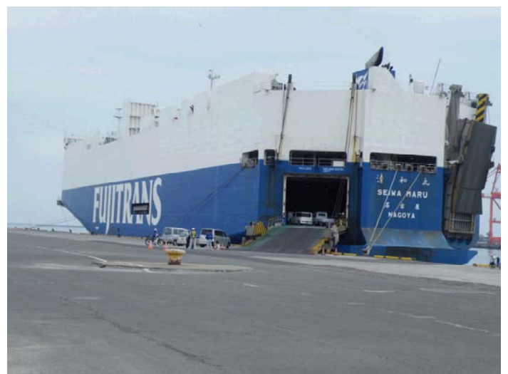
●中野3号に入港した自動車運搬船 4月8日