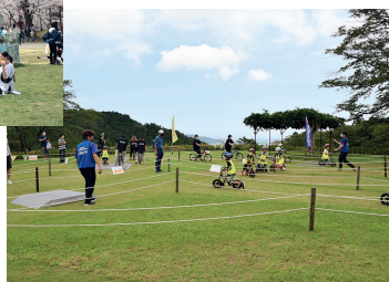
自然の中で楽しく遊べる柴田町太陽の村キッズバイクパーク

なっています。 子どもたちに大人気の遊具施設、そり遊びも楽しめる広大な芝生、町の特産品などを使ったメニューが並ぶレストランなどに加え、昨年、県内でも数少ないキックバイクとマウンテンバイクのコースを備えたキッズバイクパークが完成しました。魅力満点の太陽の村にぜひお越しください。