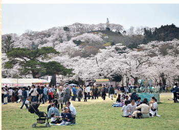
毎年4月には桜色に染まり、多くの観光客でにぎわう船岡城址公園

四季を通じて豊かな自然に囲まれ、雄大な景色を望むことができ、柴田町太陽の村は、子どもから大人まで幅広い世代の憩いの場と