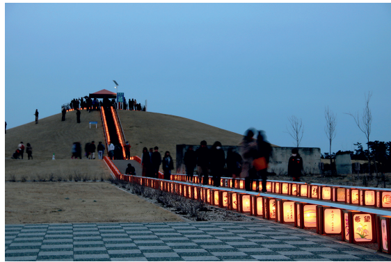
千年希望の丘相野釜公園が「希望の灯火」に包まれます

されます。 物語では宮城県や岩沼市に縁のあるものが登場しますので、ぜひご覧ください。