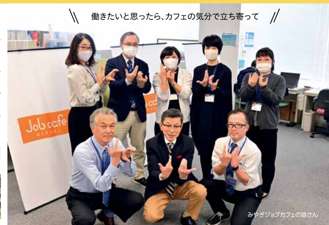
みやぎジョブカフェの皆さん