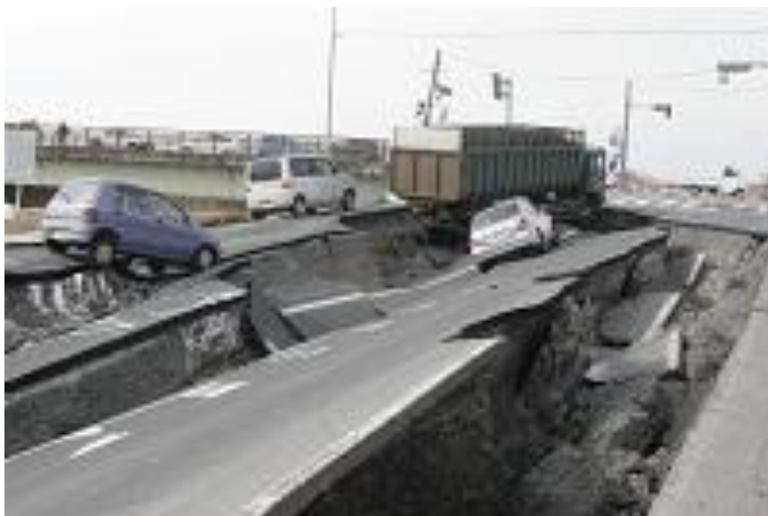
3月11日 大崎市古川江合橋付近 崩落する道路（大崎市）