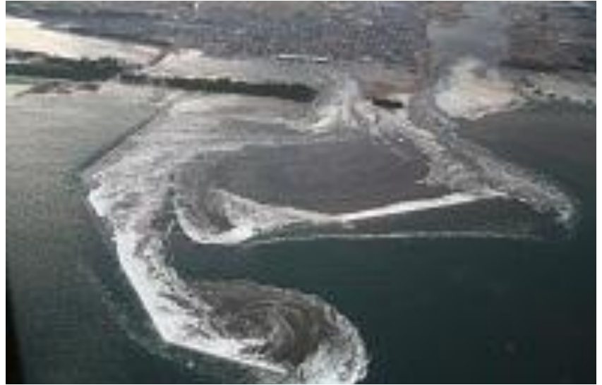
名取市関上漁港へ流入する津波