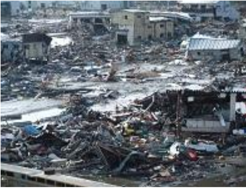
3月12日 気仙沼市朝日町