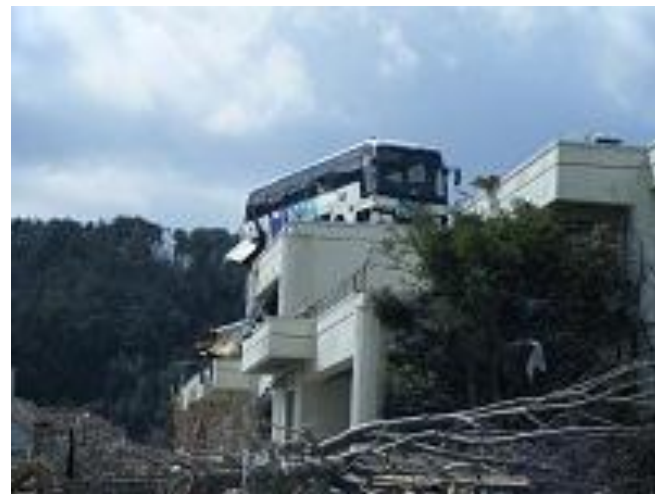
3月18日 津波により雄勝公民館の屋上に乗り上げたバス(石巻市)