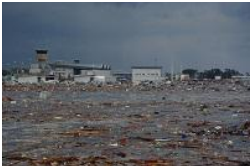
がれきに覆われた仙台空港（第二管区海上保安本部）