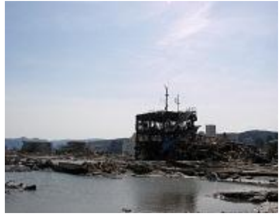
3月14日 南三陸町 防災対策庁舎