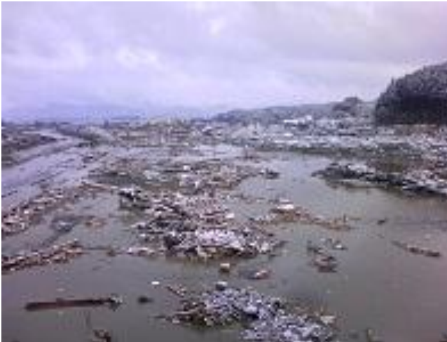
3月11日 津波襲来後の南三陸町