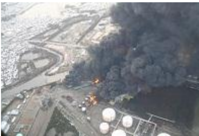
3月11日 黒煙を上げるJX日鉱日石仙台タンク（第二管区海上保安本部）