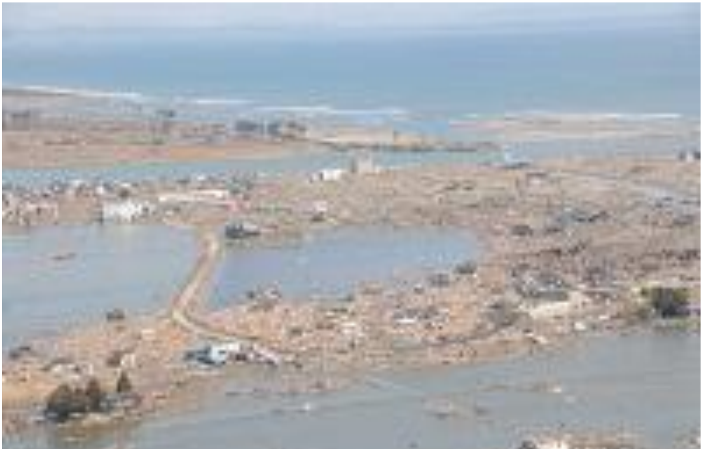
名取市関上（名取市）