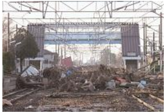
3月14日 がれきに覆われた JR 浜吉田駅(亶理町)