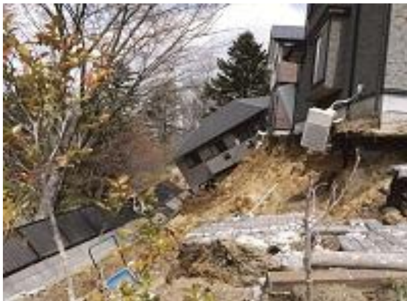
仙台市青葉区西花苑 丘陵部の宅地被害（仙台市）