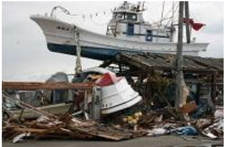
3月17日 津波により建物の上に乗上げた船（七ヶ浜町）