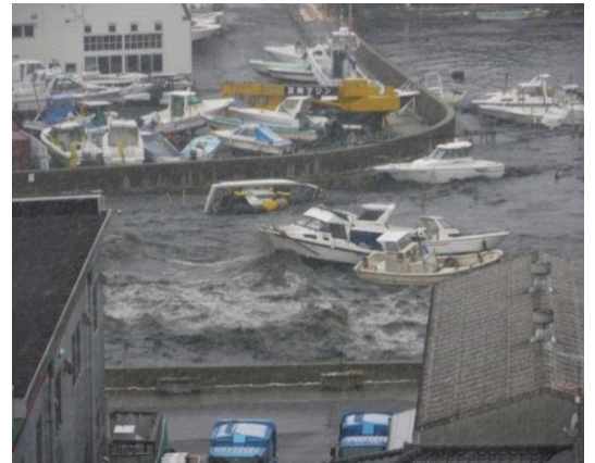
塩竈市 貞山運河に流入する津波