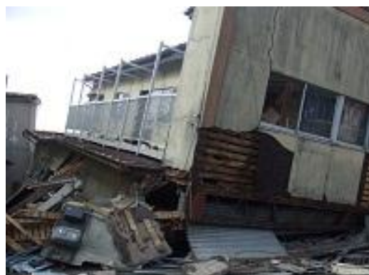
3月18日 登米市迫町 建物の倒壊