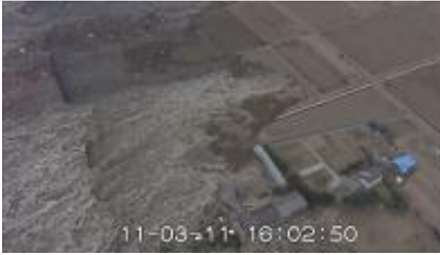
名取市上空 仙台平野を襲う津波（自衛隊）