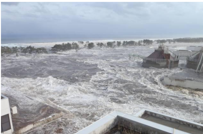
岩沼市下野郷 防潮林を越える津波