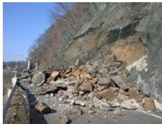
川崎町大字支倉地内 道路のり面の崩落（川崎町）