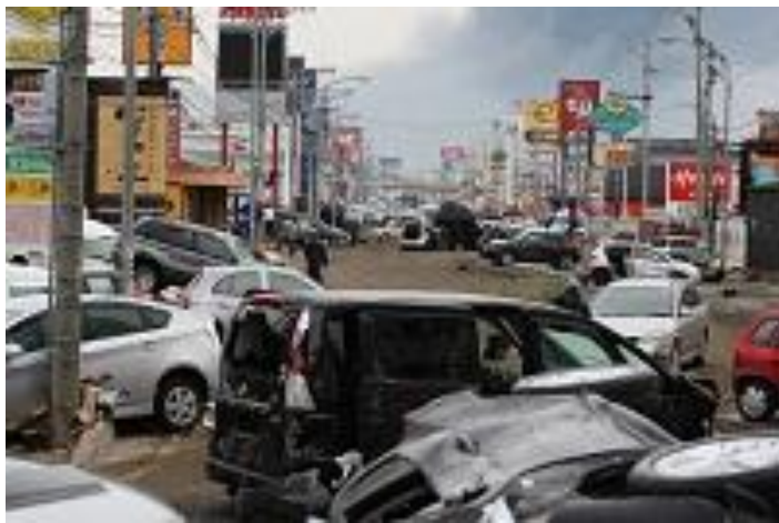
3月13日 多賀城市八幡前（自衛隊）