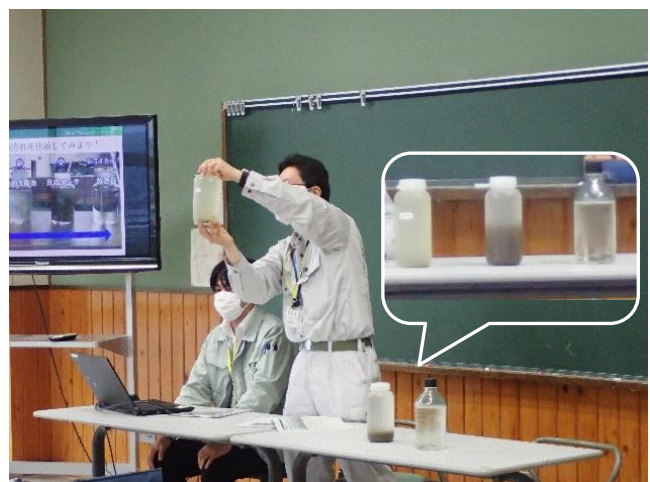
下水処理水の比較