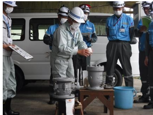
<講義（空気弁の構造）>