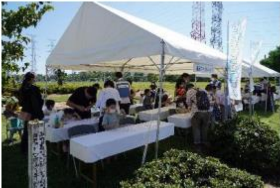
<親子ワークショップ>