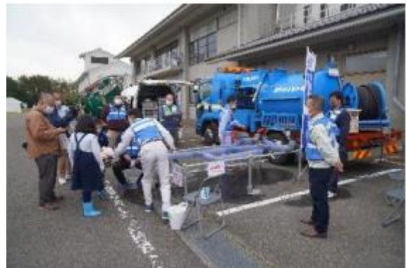
<高圧洗浄車ゲーム>