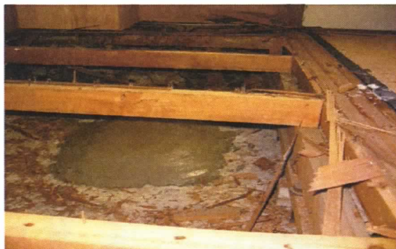
(無収縮モルタルにて充填)