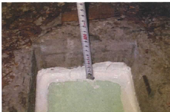
(底面スライ敷き・隙間をシーリング)