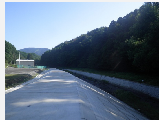
下流(No.15)から上流を望む(右岸施工完了)