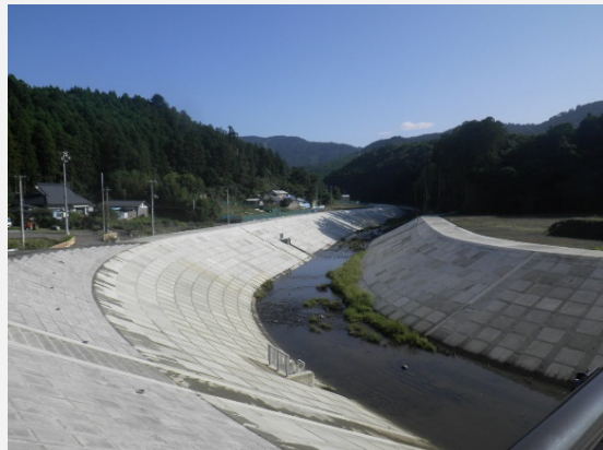
下流(No.6から上流を望む(右岸施工完了))