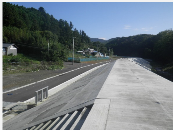
上流(No.8)から上流を望む(右岸市道施工完了)