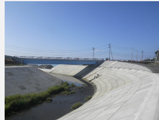
上流(No.8)から下流を望む(右岸施工完了)