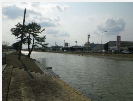
左右岸護岸工完成