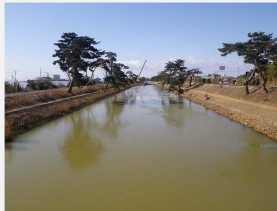
左右岸護岸工完成