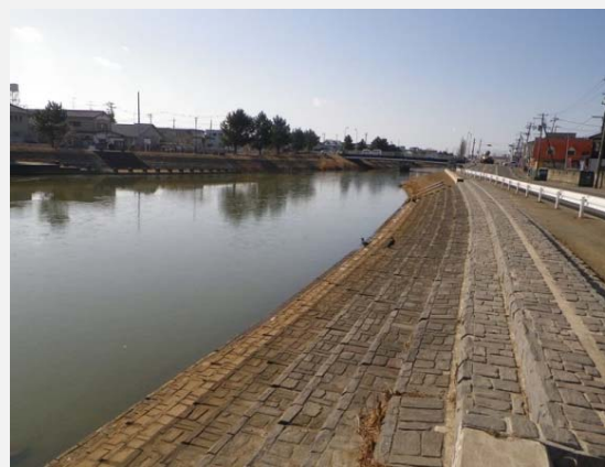
左右岸護岸工完成