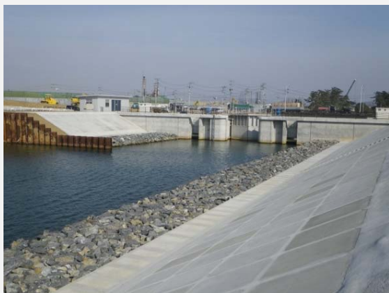
釜閘門ゲート・操作室の施工完了