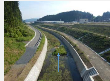
上流から中流方向(ウジエスーパー付近)完成