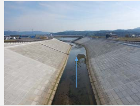
新大森橋付近から下流方向(曙橋) 完成