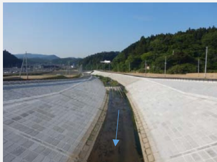
中流域から上流方向(未来橋)方向 完成