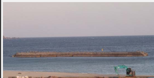
② 着手前 平成25年7月