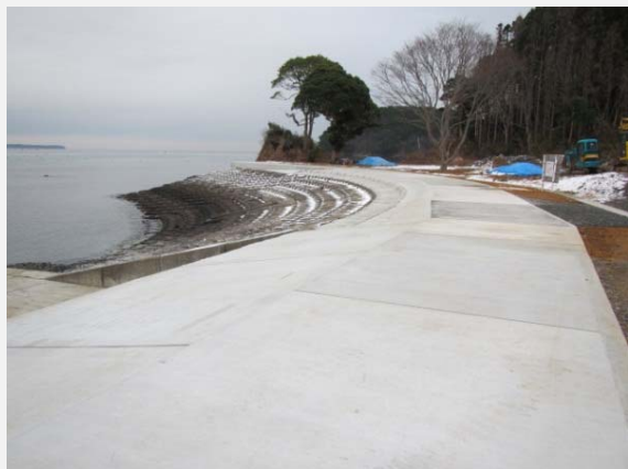
コンクリート張式護岸工・天端被覆工完成。