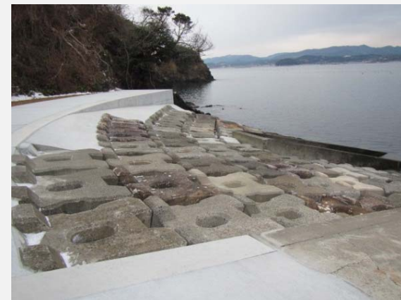
区間①ブロック張式護岸工完成。