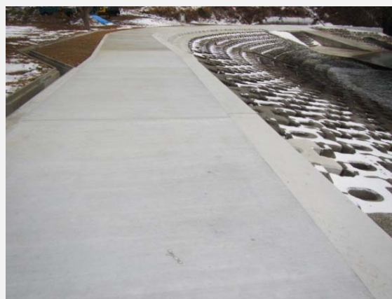
コンクリート張式護岸工・天端被覆工完成。