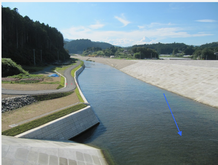
【下流側水尻橋より上流】護岸施工状況