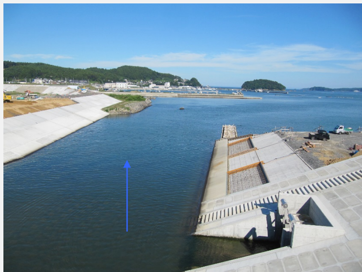
【下流側水尻橋より下流】護岸施工状況