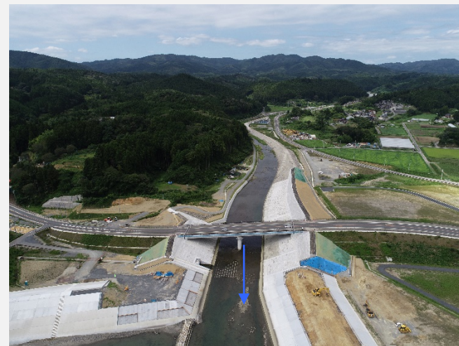
【施工中工区全景】国道橋周辺護岸施工状況