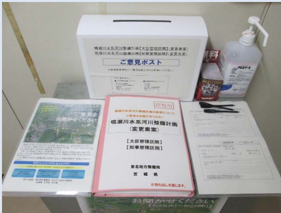
宮城県土木部河川課 意見箱設置状況