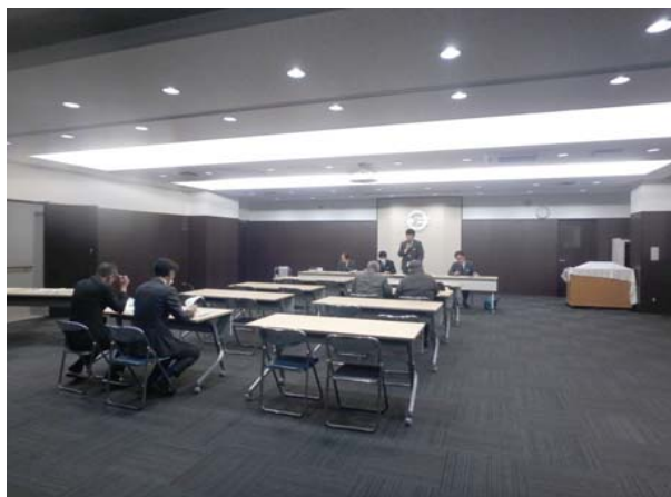
松島町での開催状況