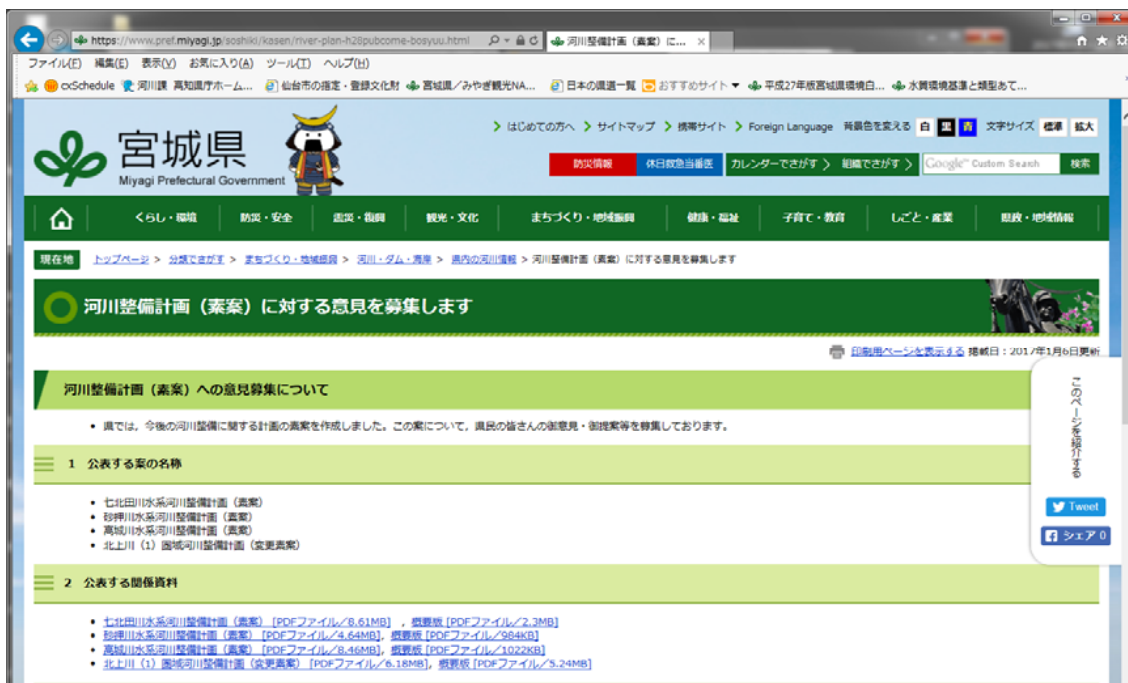
県ホームページによる周知状況