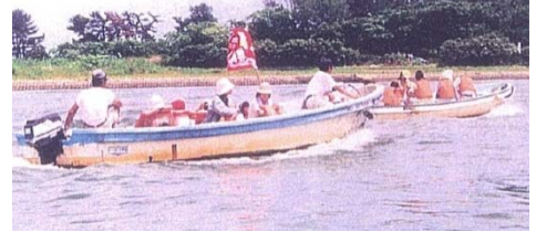
「貞山運河水紀行」・・・運河と親しむイベントが行われていました