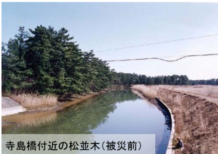
寺島橋付近の松並木(被災前)