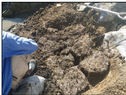
移植作業 (岩井崎海岸)