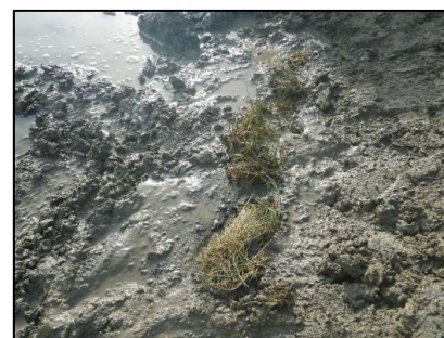
オオシバナ移植状況 (津谷川右岸湿地)