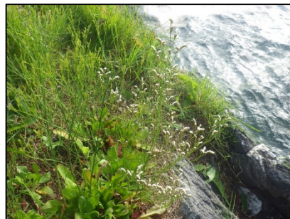
ハマサジ（岩井崎海岸）