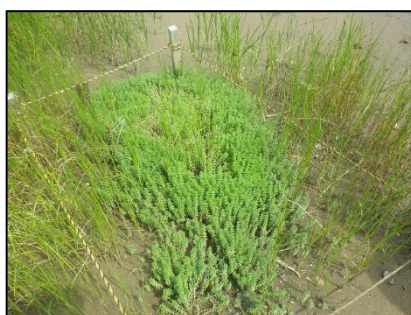
ウミミドリ（津谷川右岸湿地）