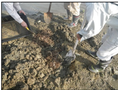
移植作業状況 (津谷川右岸湿地)