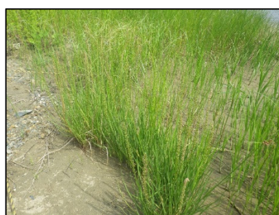
オオシバナ（津谷川右岸湿地）