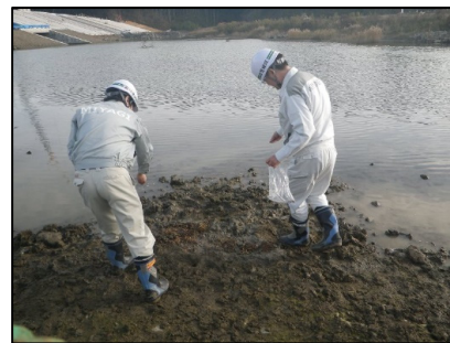
播種作業状況 (津谷川右岸湿地)