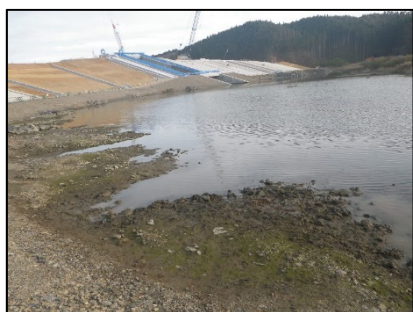
ウミミドリ・オオシバナ移植地 (津谷川右岸湿地)