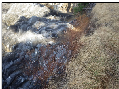
結実したハマサジ