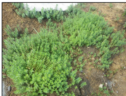
ウミミドリ（岩井崎海岸）

移植した3種ともに、その後のモニタリング調査で継続して生育及び開花・結実が確認されている。