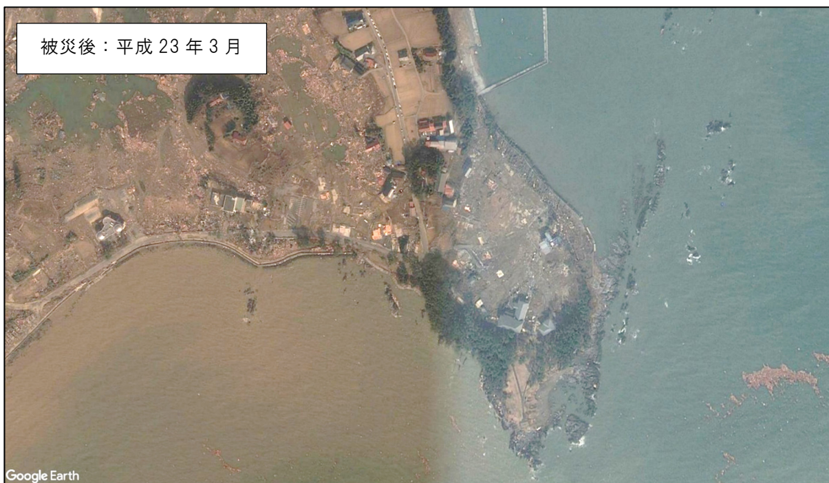
写真 4-5-1 震災後の岩井崎海岸の状況【岩井崎海岸】

岩井崎海岸は、地震による津波の影響により護岸の沈下や防護柵の破損等の被害を受けた。