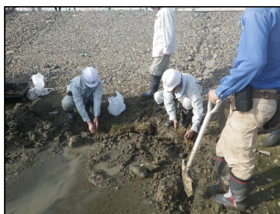
移植作業状況 (津谷川右岸湿地)