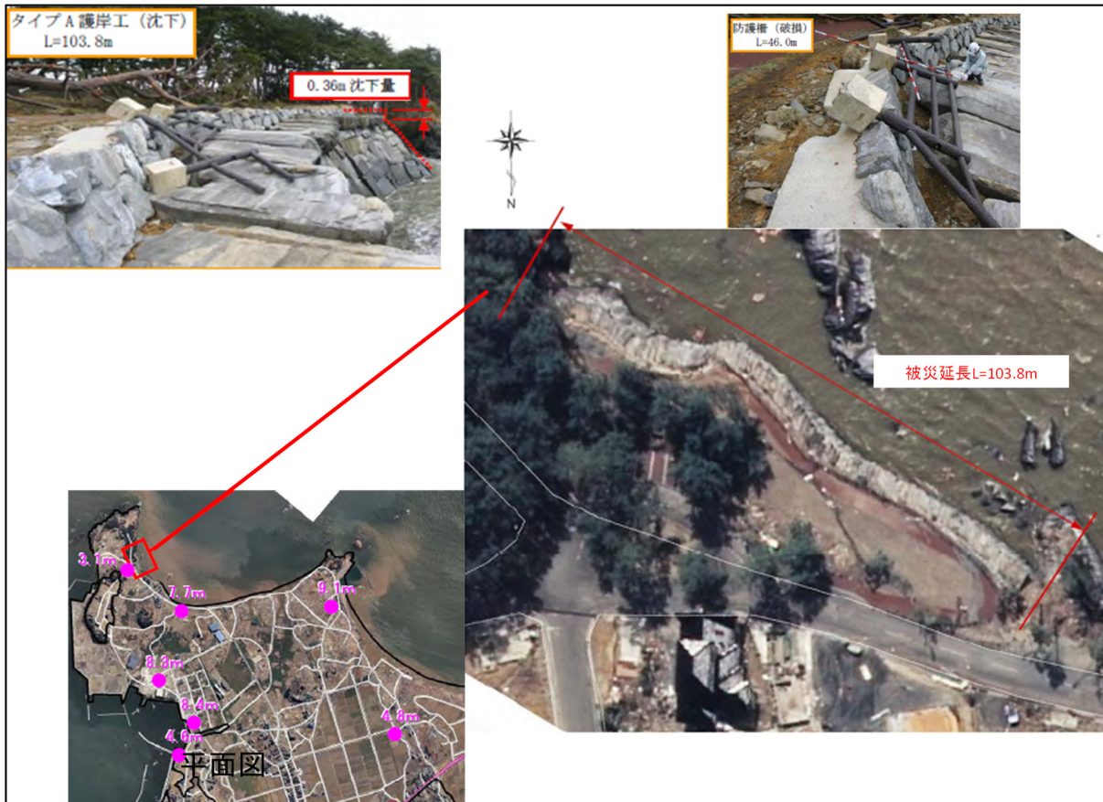
図 4-5-2 被災状況【岩井崎海岸】