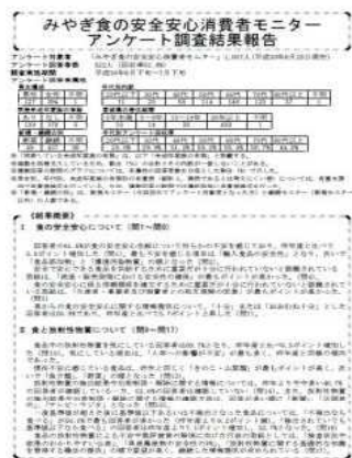
消費者モニターアンケート調査票

消費者モニターに対するアンケート，みやぎ食の安全安心推進会議，地方懇談会，食の安全安心セミナー，消費者モニター研修会，食品衛生監視指導計画へのパブリックコメント等により，広く県民の意見を把握した。また，幅広い年齢層からの意見が得られるよう，若年層に留意した消費者モニターの募集活動を行った。（食暮）