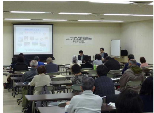
食の安全安心セミナー（放射性物質）