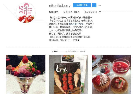
こここベリー公式Instagram