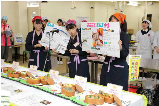
高校生地産地消お弁当コンテスト最終審査会の様子