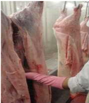
と畜検査（枝肉）の様子