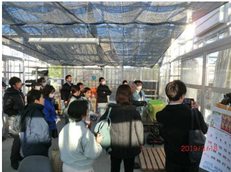
GAP指導者養成研修会

農業生産工程管理（GAP）の導入推進のため、宮城県GAP推進会議を開催し進捗状況や推進方向等について、関係機関や関係団体等との共有を図り、それぞれの分担や連携に基づいてGAPの普及・拡大に向けた取組を推進した。（農環）