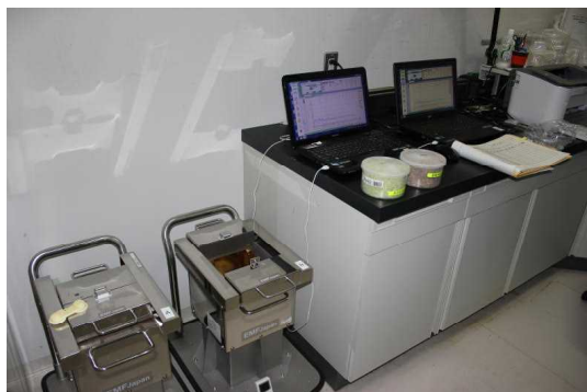
牧草を検査するNaIシンチレーション検出器