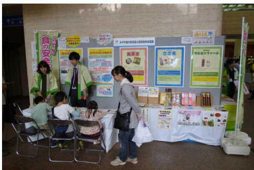
まるごとフェスティバル

生産者及び事業者が自らの食の安全安心に関する取組を自主基準として定め、公開する「みやぎ食の安全安心取組宣言」の広報・募集を実施したほか、取組宣言者や自主基準の検索・閲覧ができる検索シートを県ホームページに掲載した。また、商品貼付用ロゴマークシールを取組宣言者に提供した。さらに、消費者の認知度向上のため、みやぎまるごとフェスティバル等の集客行事で広報活動を実施し、県民総参加運動の機運醸成に努めた。（食暮）