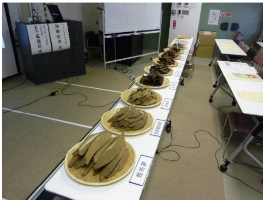
食の安全安心セミナー

食の安全安心に関する知識習得の機会を提供するため、食の安全安心セミナー、地方懇談会等各種講習会を開催した。また、要請に応じて出前講座を行い、参加者の知識向上を図った。（食暮）