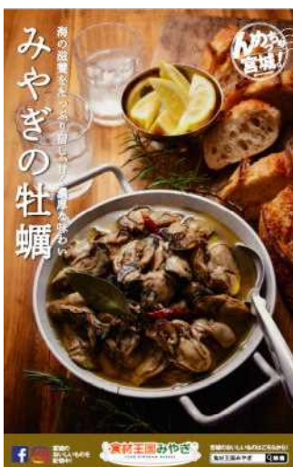
魅力発信事業交通広告