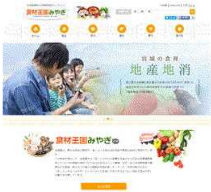
食材王国みやぎウェブサイト