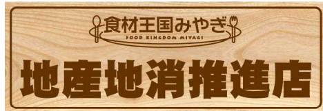
食材王国みやぎ地産地消推進店表示板