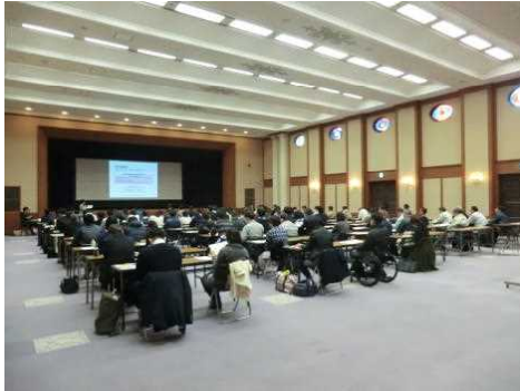
農薬管理指導士研修会

農薬の適正使用の推進については、農業生産の安定と安全な農産物生産・供給を図るため、農薬使用者を主な対象に、農薬危害防止運動（平成30年6月1日～8月31日）を実施したほか、農薬危害防止研修会や農薬管理指導士養成研修会（認定試験）・更新研修会を開催するなど農薬の適正使用の普及に努めた。（農環）