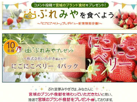
ふれ宮みやぎプレゼントキャンペーン