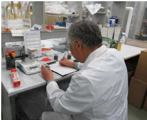
放射性物質検査の状況

また、放射性物質検査の計画・結果は、県ホームページ「放射能情報サイトみやぎ」等で、速やかに公表した。（食産）（農環）（畜産）（林振）（水産）（自保）