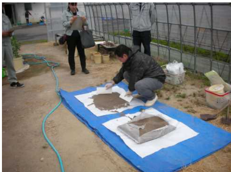
肥料収去の研修(古川試験場)