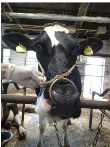
耳標を装着した牛

生産段階における耳標（個体識別番号）の装着徹底を推進するとともに、生産から流通までの各段階における牛の個体を識別することができるシステム維持のため、耳標装着に係る各種手続き及び登録エラー解消等の支援を行った。（畜産）