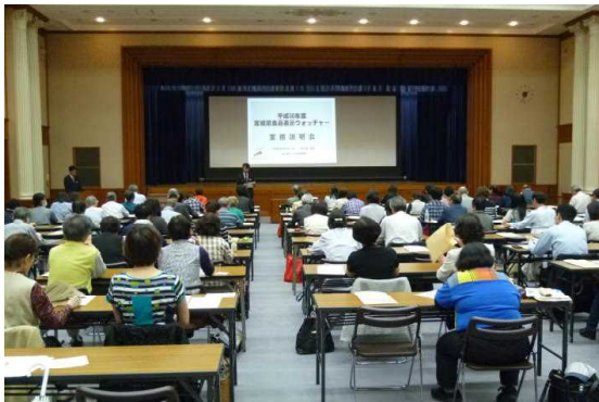
食品表示ウォッチャー業務説明会

不適正表示の疑義があった事業者に対しては、確認調査を実施し、必要な指導を行った。（食暮）