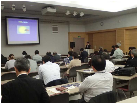
放射線・放射能に関するセミナー