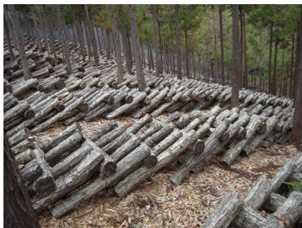
管理された原木しいたけの生産現場