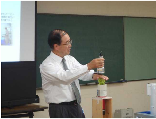
住民持ち込み放射能測定市町村担当者研修会