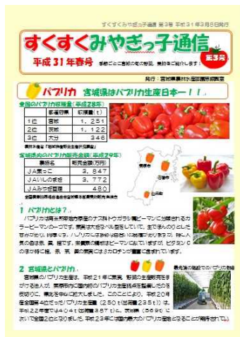
すくすくみやぎっ子通信

【施策29の成果】 消費者モニターを対象にアンケート調査を実施し、県民の意向を把握するとともに、消費者モニターが参加する食品工場見学会・生産者との交流会の実施により、消費者と生産者・事業者の相互理解を深めた。また、県ホームページやモニターだより等で情報提供を行った結果、「県からの情報提供が十分・概ね十分と感じる消費者モニターの割合」が50.9%となり、前年度に比べ5.7ポイント増加した。