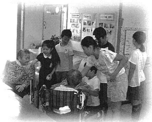
南郷小学校「いなほの里交流活動」