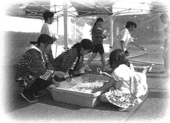
南郷中学校「田園フェスティバルのボランティア」