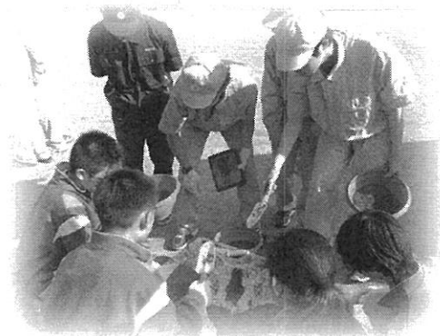
南郷高校「フラワーサービスプロジェクト」

南郷地区の小・中・高との互いの連携、及びそれぞれが地域との連携を通し、南郷地区の素晴らしさを発見・再確認し、未来の南郷地区について、地域の方々や行政の方々と、ともに考え・かたり合い、未来の町づくりに興味・関心を持つ絶好の機会とする。