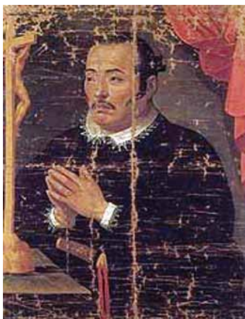
国宝 支倉常長像（仙台市博物館所蔵）