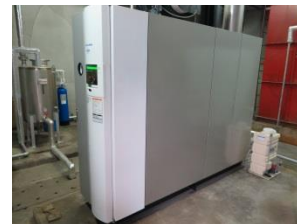
ボイラー (食品製造工場への設置)