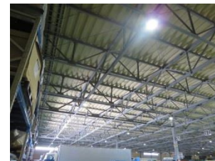
LED照明 (物流倉庫への設置)