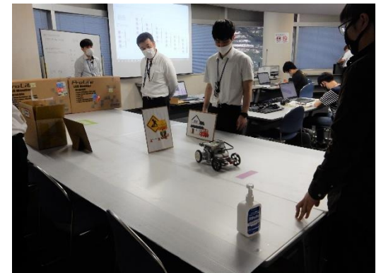
みやぎカーインテリジェント人材育成センター事業 (R2年度 E2講座: MBD(モデルベース開発))