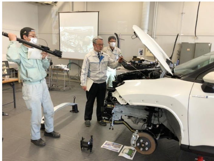
R2年度 自動車部品機能・構造研修