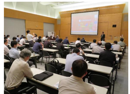
R2年度生産改善事例発表会