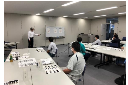
R2年度 ものづくり「改善」入門