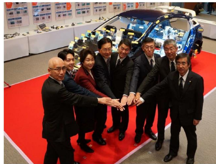
R元年度 8道県知事によるトップセールス