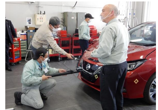
自動車部品機能・構造研修事業 (R2年度 講座3: 先進運転支援システム(ADAS)編)