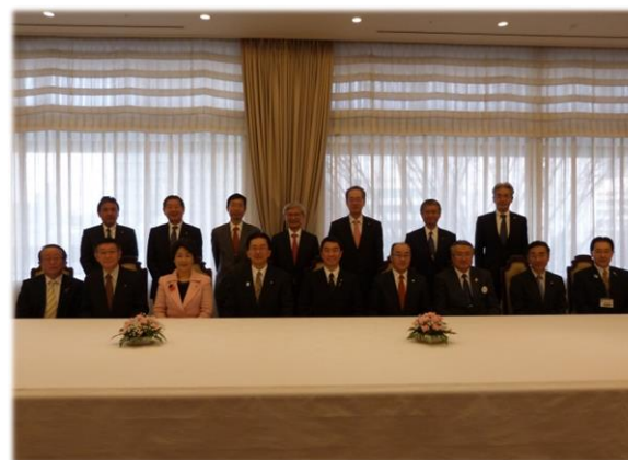
＜参考＞東北各県知事によるトップセールス (H27.2.5)