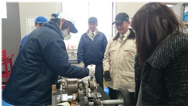
＜参考＞アクア部品技術研修