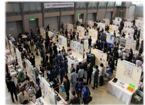
<参考>とうほく・北海道自動車関連技術 展示商談会(H27.2.5-6 刈谷市)