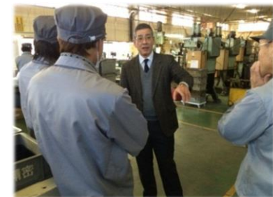
<参考>生産現場改善支援事業

学生の自動車産業に対する理解や関心の向上を図るため、開発設計分野を中心とした人材育成講座を実施