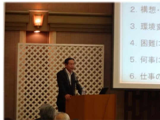
<参考>平成26年度次世代経営セミナー(H26.9.17)

基礎的勉強会(コスト・原価・TPS等), 技術セミナー, 先進事例セミナー等, 受講対象者を絞り込んだ 形式での開催を予定(年4回程度)