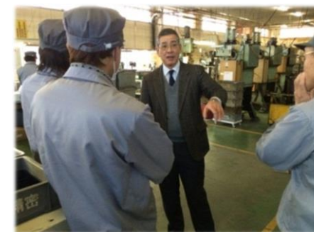
<参考>生産現場改善支援事業

自動車部品を構成部品単位で分解し、機能構造を理解することで、自社の製品提案と合致した参入へのイメージを具体化