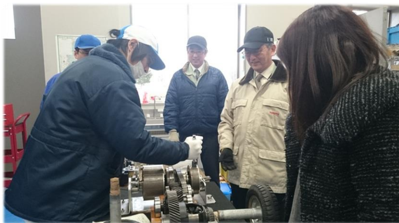
＜参考＞自動車部品機能・構造研修