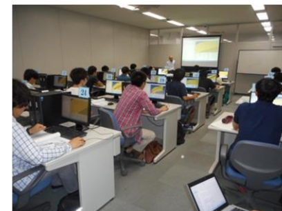
<参考>みやぎカーインテリジェント人材育成センター事業

学生の自動車産業に対する理解の向上や関心を高めるため、開発設計分野を中心とした人材育成講座を実施