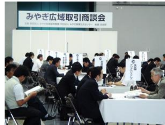
みやぎ広域取引商談会(H27.6.15)