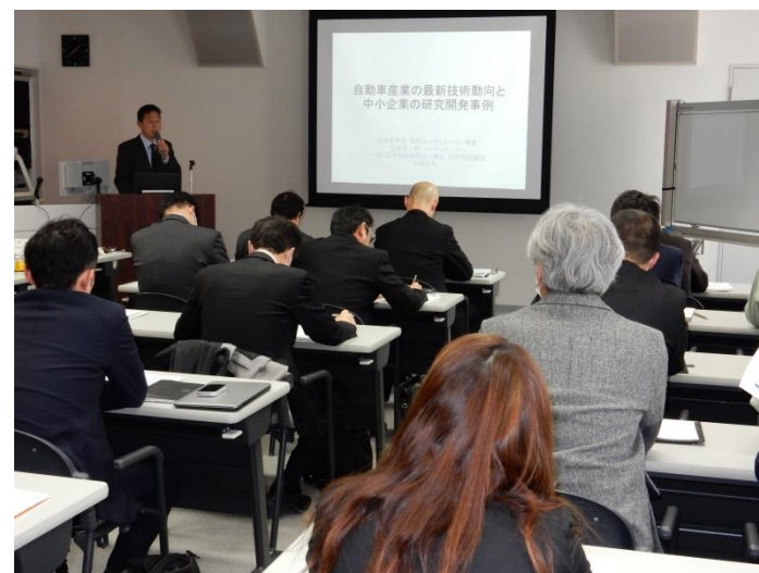
<参考> 自動車産業革新技術セミナーinみやぎ(H28.3.17)