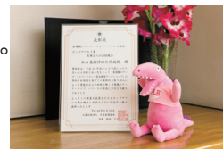
H28カンゴザウルス賞受賞