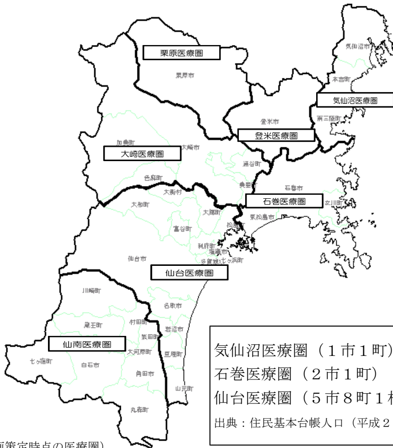
(H24.2月計画策定時点の医療圏)