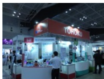
販路拡大に向けた ICT技術の展示会

起業や産業の創出・育成に向けたICTのフル活用や農林水産業、観光業等をはじめとする様々な分野でのICT利活用の促進