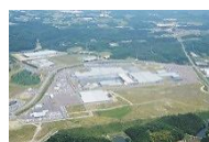
製造業の集積が進む 仙台北部中核工業団地

企業立地奨励金等のインセンティブの強化や今後不足が懸念される事業用地の確保・整備の促進