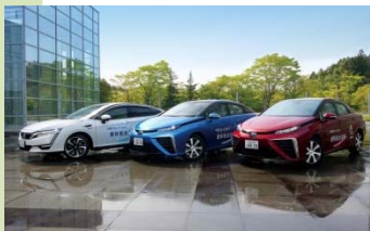
県が導入したF C V

燃料電池自動車(FCV)や家庭用燃料電池(エネファーム)などの普及促進による水素エネルギー利活用の推進