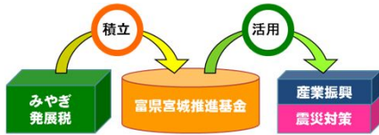
【基金の積立額と活用額】

▽ 富県宮城推進基金に積み立ててから、活用することで、その税収額及び用途を明確化